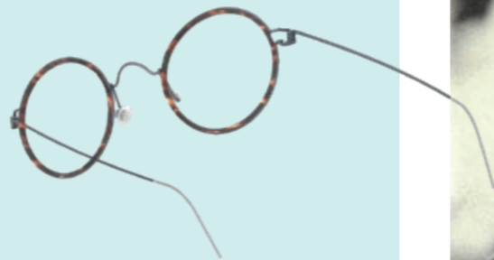
LINDBERG HARLEY € 645