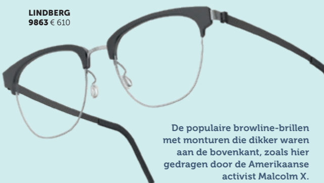
LINDBERG 9863 € 610

LINDBERG gebruikt duurzame materialen zoals titanium, goud, platina, buffelhoorn, hout en diamanten. De brillen zijn ontworpen voor de verfijnde minimalist die waarde hecht aan onberispelijk design en kwaliteit.