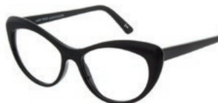
ANDY WOLF 5088 € 440