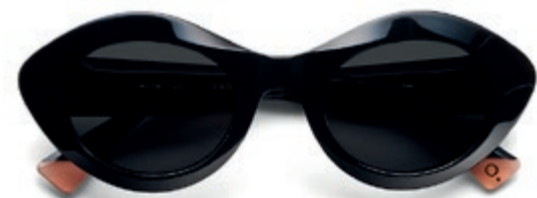
ETNIA 5 AMPAT € 179