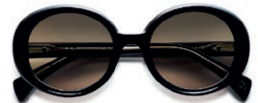
ETNIA 5 AUDREY € 219