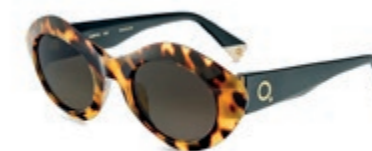
ETNIA 5 AMPAT € 179