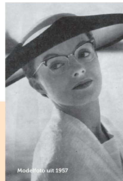
Modelfoto uit 1957