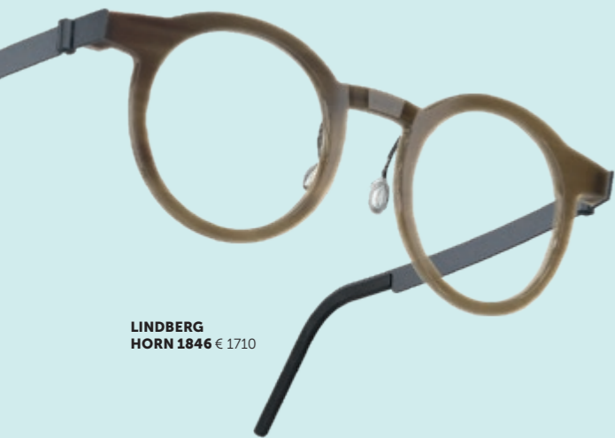
LINDBERG HORN 1846 € 1710

LINDBERG eyewear staat voor kwaliteit, comfort en innovatie en belichaamt Deens design. Elk stuk wordt ontworpen en vervaardigd in Denemarken, met een focus op grensverleggende vindingrijkheid. Sinds 2021 maakt LINDBERG deel uit van Kering Eyewear, dat brillen ontwerpt en distribueert voor diverse luxemerken zoals Gucci, Saint Laurent en Balenciaga.