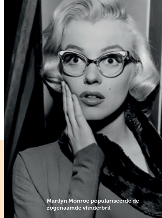
Marilyn Monroe populariseerde de zogenaamde vlinderbril