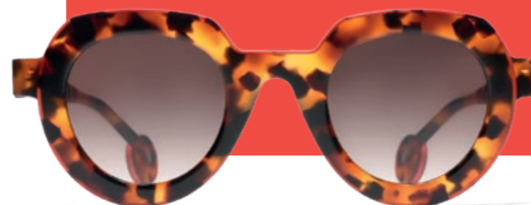
THEO MARIANNE € 322

Nu wordt THEO verkocht in 1400 winkels verspreid over een 50-tal landen, heeft het bedrijf zo'n 1578 verschillende brilmodellen.