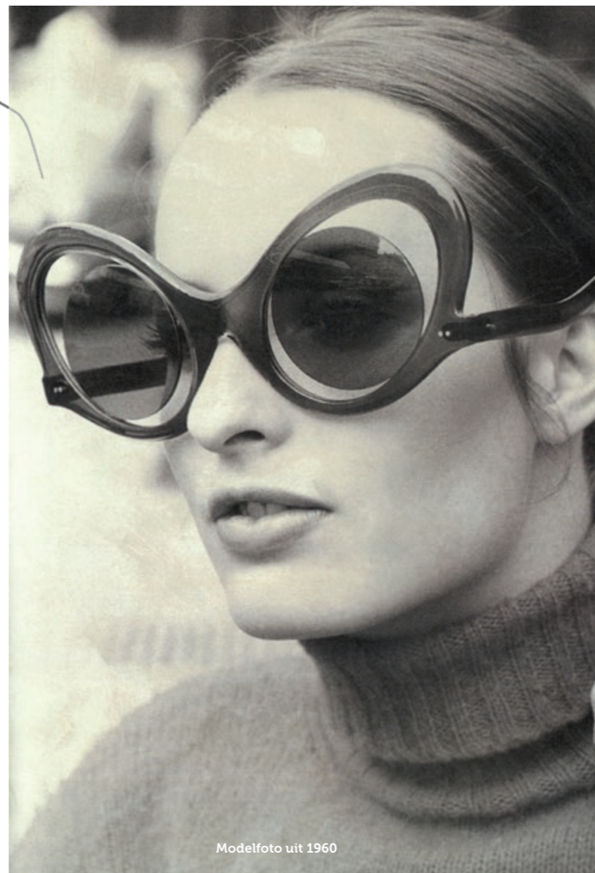
Modelfoto uit 1960