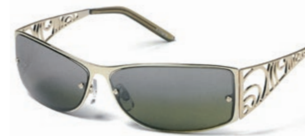
MODEL UIT 2004