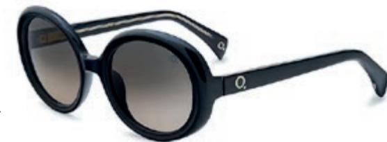
ETNIA 5 AUDREY € 219

Etnia Barcelona staat voor vrijheid, menselijkheid en respect voor alle etniciteiten en expressievormen. De stad Barcelona, bekend om haar innovatie en visie, speelt een cruciale rol in de identiteit van het merk en weerspiegelt haar dynamische en vooruitstrevende karakter, terwijl het altijd trouw blijft aan zijn roots.